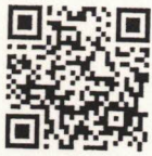
QR-Code เพื่อจองห้องพัก

โทรศัพท์: ๐๒-๔๒๒-๙๒๒๒ E-mail : rsvn@royalriverhotel.com